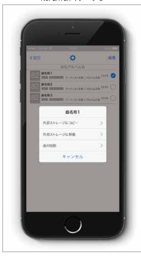
NePLAYER イメージ 3