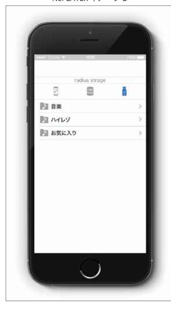
NePLAYER イメージ 2